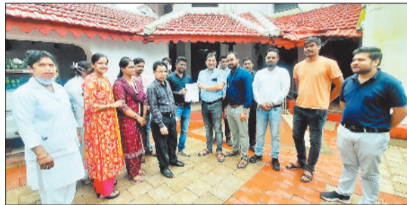
सीएमएचओ को ज्ञापन सौंपते कर्मचारी।

कर्मचारियों ने बताया कि इस सामूहिक अवकाश का उद्देश्य विधानसभा चुनाव 2023 के दौरान शासन द्वारा किए गए वादों, विशेषकर शमीदी की गार्डर के अंतर्गत 100 दिवस में कमेटी गठन व नियमितकरण हेतु निर्णय की मांग को लेकर किया जा रहा है। साथ ही कर्मचारियों ने पूर्ववर्ती कांग्रेस सरकार द्वारा 27 प्रतिशत वेतन वृद्धि की घोषणा को लागू करवाने की भी मांग देकराई है।