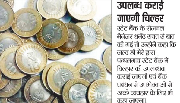
उपलब्ध कराई जाएगी चिलहर