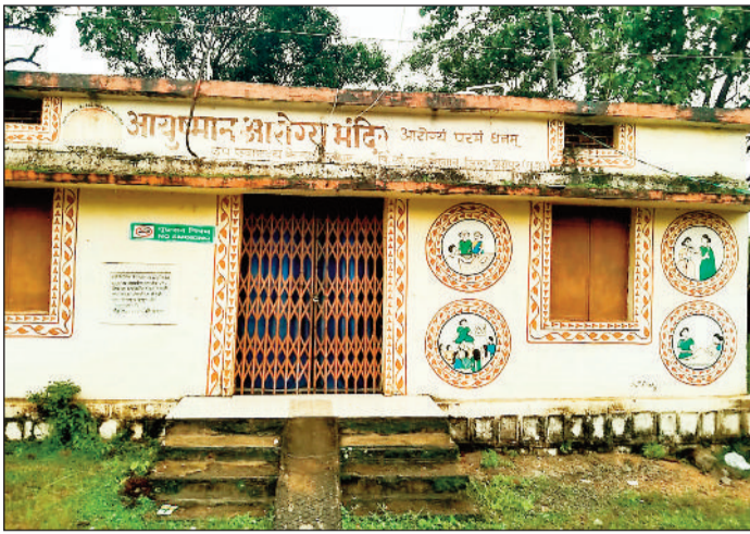
कछार का बंद पड़ा उप स्वास्थ्य केंद्र।

ग्राम कछार में बना उप स्वास्थ्य केंद्र लगातार बंद रहता है। यही कारण है कि स्वास्थ्य संबंधी इलाज के लिए यहां पहुंचने वाले ग्रामीणों को उप-स्वास्थ्य केंद्र का लाभ नहीं मिल पा रहा है। शासन ने लोगों को ग्राम में ही स्वास्थ्य लाभ देने की मनसा से यहां उप स्वास्थ्य केंद्र खोला था। करीबन एक वर्ष पहले यह उप स्वास्थ्य केंद्र हमेशा खुला रहता था, पर अब लगातार बंद रहने से ग्रामीणों को उप स्वास्थ्य केंद्र का लाभ नहीं मिल पा रहा है।